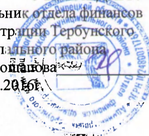
ГРАФИК проведения ревизий финансово-хозяйственной деятельности бюджетных учреждений Тербунского муниципального района на 2017 г.

УТВЕРЖДАЮ: Начальник отдела финансов администрации Тербунского муниципального района О.И.Голойшова от 15.12.2016г.